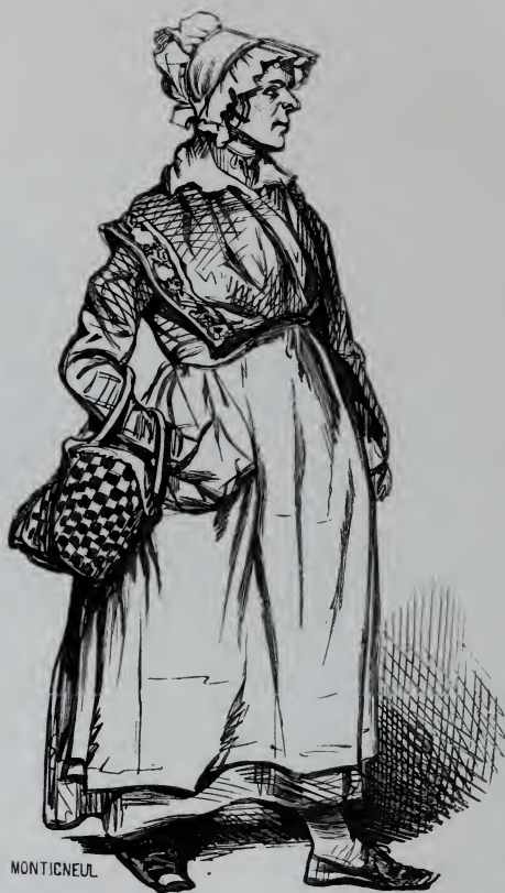
La Femme de Ménage.